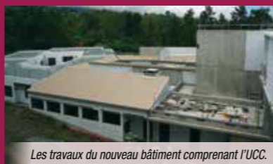
Les travaux du nouveau bâtiment comprenant l'UCC.

L'opération d'investissement d'un montant de 14 millions d'euros apporte des réponses optimisées en termes de prise en charge du patient sur les deux champs d'activités déployées au Tampon, la Gériatrie et la Médecine Physique et Réadaptation (MPR). La première phase de travaux doit conduire à l'ouverture du plateau technique en 2016; la livraison de l'UCC et d'une unité accueillant des patients en état végétatif chronique ou en état pauci-relationnel, doit intervenir en 2017. Le projet a bénéficié d'une subvention d'investissement de la part de l'ARS-OI d'un montant de 5 millions d'euros. Cette opération d'envergure devrait être complétée par la reconstruction de l'unité de soins de longue durée (USLD) pour laquelle une demande de financement par des fonds FEDER est déposée.