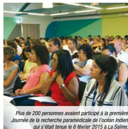
Plus de 200 personnes avaient participé à la première Journée de la recherche paramédicale de l'océan Indien qui s'était tenue le 6 février 2015 à La Saline.

La conduite de projets de recherche, qui était jusqu'à maintenant un exercice d'école pour la majorité des paramédicaux, devient petit à petit une réalité pour des professionnels