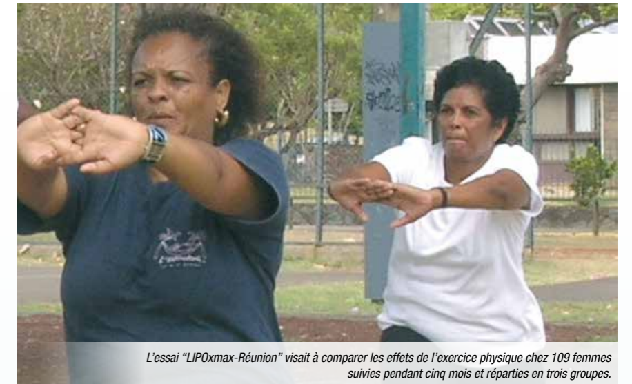
L'essai « LIPOxmax-Réunion » vise à comparer les effets de l'exercice physique chez 109 femmes suivies pendant cinq mois et réparties en trois groupes.

Les résultats montrent une perte de masse grasse dans les trois groupes, sans différence significative entre les groupes, une baisse de l'insulinémie et de l'hémoglobine glyquée, une amélioration du stress oxydatif et du statut inflammatoire. C'est dans le groupe LIPOxmax (activité à basse intensité permettant une oxydation lipidique maximale) que le contrôle de la glycémie est le meilleur et l'oxydation des lipides la plus importante.