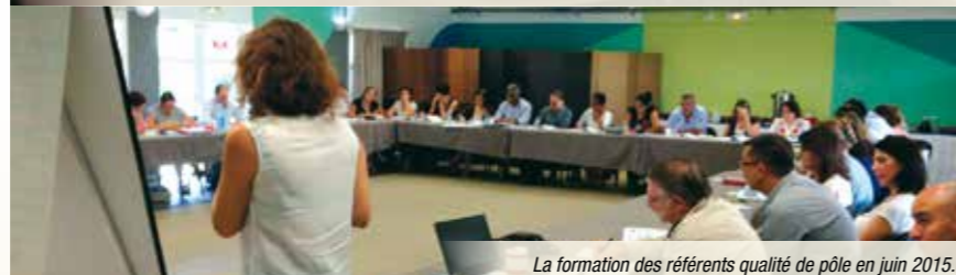
La formation des référents qualité de pôle en juin 2015.

des relations avec les usagers et de la qualité de la prise en charge), ou encore des rapports d'inspection et des résultats d'audits.