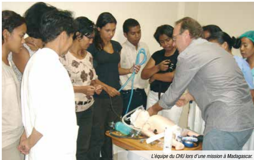
L'équipe du CHU lors d'une mission à Madagascar.

La mission de coopération sur le CHU de Tananarive nécessite donc d'être poursuivie. Un élargissement du périmètre de nos actions a démarré vers la maternité du Pavillon Sainte-Fleur (Maternité de 60 lits, gérée par l'Ordre de Malte et localisée sur le site du CHU).