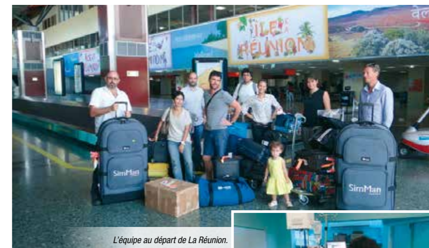
L'équipe au départ de La Réunion.

Le programme très complet de la mission portait essentiellement sur l'évaluation des pratiques enseignées lors de la dernière mission de septembre 2015, ainsi que sur l'hémorragie post-partum, permettant aussi d'aborder