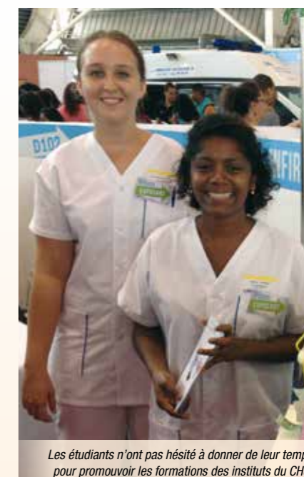
Les étudiants n'ont pas hésité à donner de leur temps pour promouvoir les formations des instituts du CHU.

Outre notre mission de promotion de nos formations auprès d'un public de collégiens, de lycéens et de personnes en reconversion, ce salon permet également à nos intervenants des moments d'échanges privilégiés entre eux. En effet, ce salon annuel de la jeunesse est aussi l'occasion de rencontrer les formateurs, les étudiants et les élèves des différents instituts des sites Nord et Sud du CHU. Ainsi, pour les étudiants et élèves, c'est la possibilité de discuter de leur formation et d'échanger sur leurs pratiques, de créer du lien entre les différents acteurs de santé qui, dans le futur, exerceront en complémentarité autour des patients. C'est aussi l'opportunité d'appréhender et de mieux comprendre, le métier de l'autre. Les étudiants apprécient ce type de manifestation et nous regrettons toujours de ne pas pouvoir faire participer plus de monde.