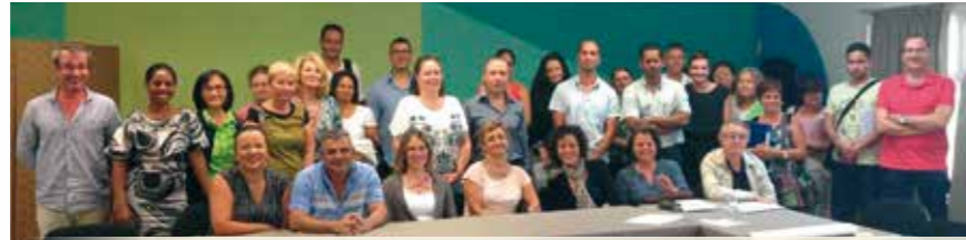
Chaque pôle d'activité a identifié un binôme médecin-cadre de santé, chargé de déployer la démarche qualité et d'instaurer une culture de sécurité au sein du pôle, avec l'aide de l'équipe qualité du CHU.

Les référents qualité s'inscrivent donc pleinement dans le dispositif de management de la qualité institutionnel, leur rôle est essentiel, sous l'impulsion de la direction et de la commission médicale d'établissement et par délégation du chef de pôle. Ces derniers s'entendent chaque année sur les actions prioritaires à mener dans leur secteur d'activité, sur la base des dysfonctionnements constatés, des préconisations de « CRUQPC » (Commission