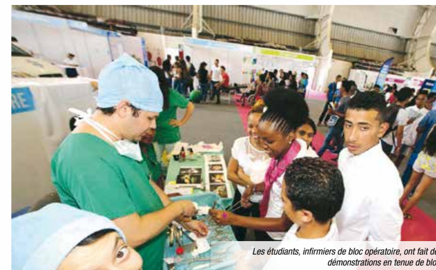
Les étudiants, infirmiers de bloc opératoire, ont fait des démonstrations en tenue de bloc.

Ainsi, pour les auxiliaires puéricultrices, c'est le change des nourrissons sur poupon qui était présenté. Pour les aides-soignantes, ce sont des démonstrations de réfection de lit et de toilette sur mannequin, mais aussi le bon usage de la solution hydro alcoolique pour le lavage des mains qui étaient réalisées. Pour les infirmiers anesthésistes, ce sont des activités de ventilation et d'intubation qui étaient présentées. Pour les infirmières, c'est la pose d'une perfusion sur un bras de démonstration qui a attiré l'attention des visiteurs. Pour les ambulanciers, c'est