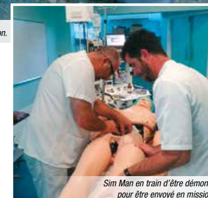
Sim Man en train d'être démonté pour être envoyé en mission.

Ces différentes missions s'inscrivent dans la continuité des actions de coopération mises en œuvre entre les Seychelles et le CHU de La Réunion en application de la convention cadre de partenariat signée le 12 novembre 2012.